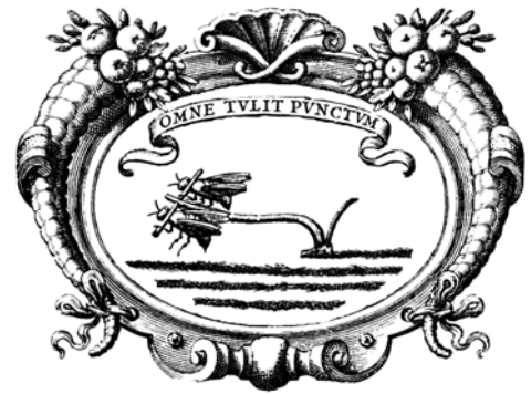
GRISO (Grupo de investigación Siglo de Oro de la Universidad de Navarra)