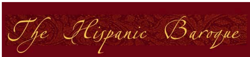
The Hispanic Baroque Project of The University of Western Ontario